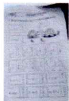
WhatsApp Image 2021-09-27 at 08.47.48