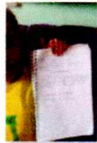
WhatsApp Image 2021-09-16 at 09.44.26