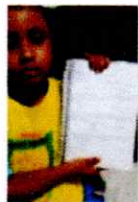
WhatsApp Image 2021-09-26 at 21.09.55