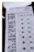
WhatsApp Image 2021-09-27 at 08.48.04