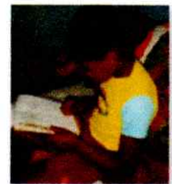
WhatsApp Image 2021-09-21 at 19.11.52