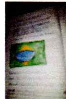
WhatsApp Image 2021-09-14 at 19.57.09 (1)