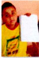
WhatsApp Image 2021-09-06 at 16.35.21