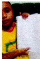
WhatsApp Image 2021-09-26 at 21.09.45