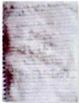
WhatsApp Image 2021-09-16 at 09.42.09