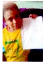
WhatsApp Image 2021-09-16 at 09.45.06