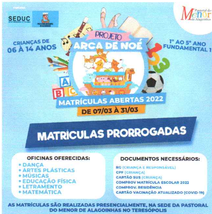
FLYER DO SEGUNDO PERÍODO DA PRORROGAÇÃO DAS INSCRIÇÕES