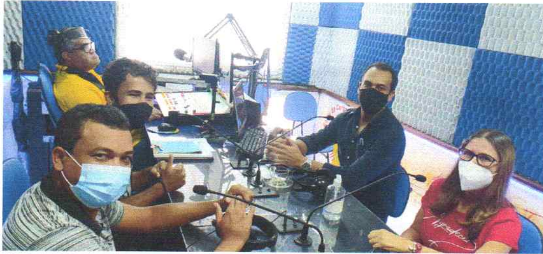
ENTREVISTA NA RÁDIO SOBRE MATRÍCULAS E OUTRAS INFORMAÇÕES DO PROJETO