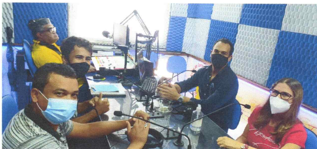
ENTREVISTA E PROPAGANDA DO PERÍODO DE INSCRIÇÕES NA RÁDIO 93 FM