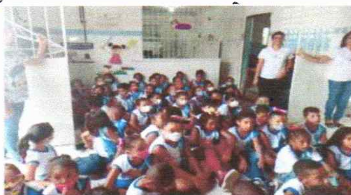
2VISITA A ESCOLA MUNICIPAL PAULO FREIRE