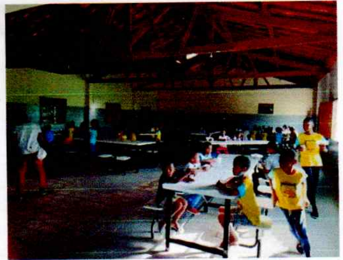
Hora do lanche