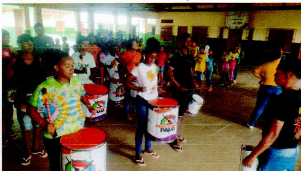
Ensaio para o desfile com a percussão