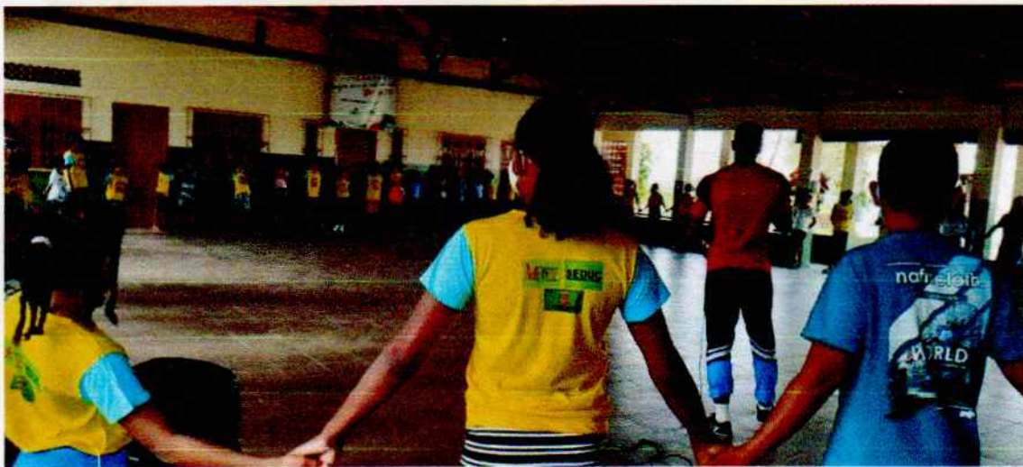
Acolhimento dos educandos