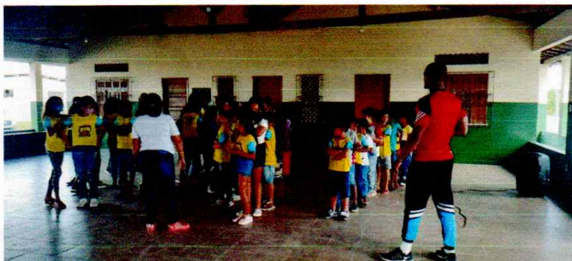
Organização das filas para o desfile (ensaio)