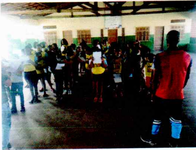
Ensaio do Hino da Bahia