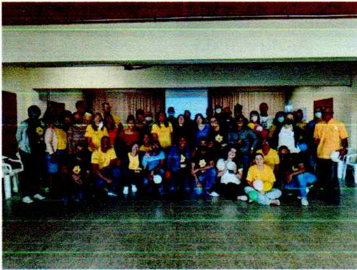
Formação II Semestre