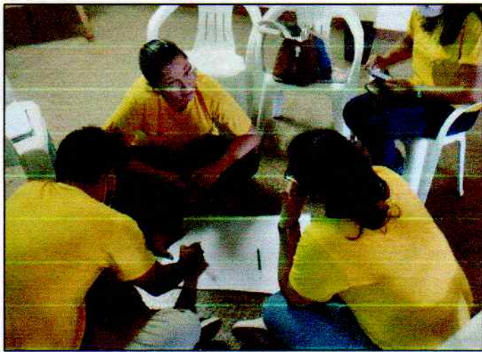
Planejamento Arca de Noé – Sítio para o II semestre Formação