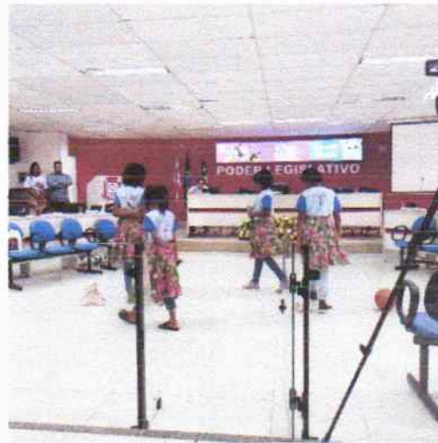
APRESENTAÇÃO DO CORDEL