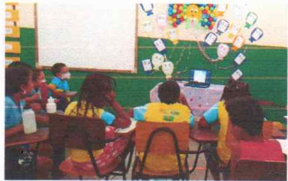
Sessão de cinema