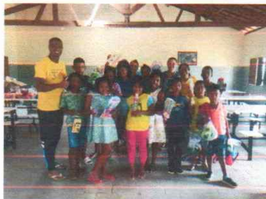
Entrega de brinquedos