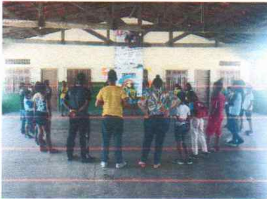
Acolhida das crianças