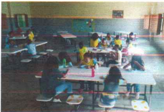
Hora do lanche