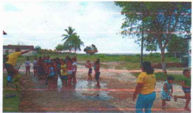
Acolhida das crianças