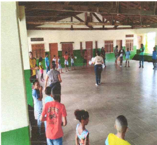
DINÂMICA COM BOLA FORMAÇÃO