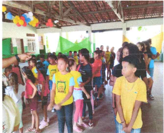
ORGANIZAÇÃO DAS TURMAS