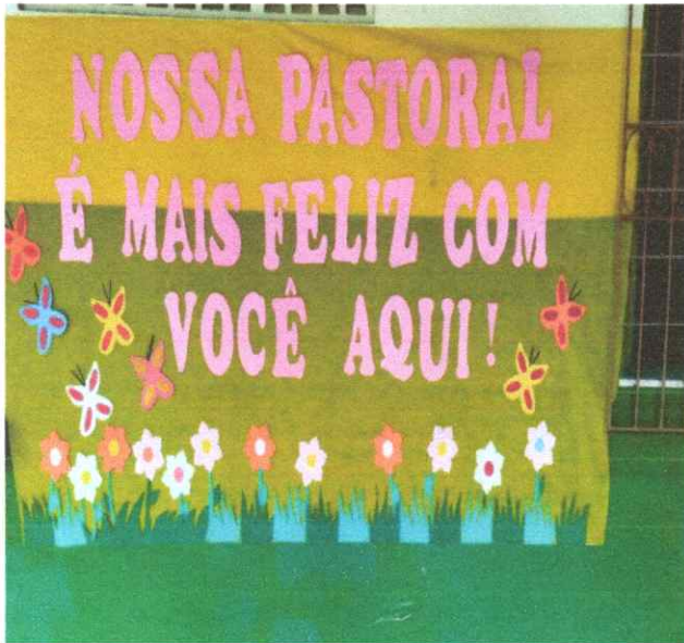
PAINEL DE BOAS VINDAS