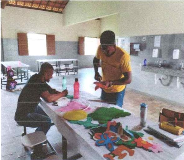
ARRUMAÇÃO DO ESPAÇO PARA FORMAÇÃO