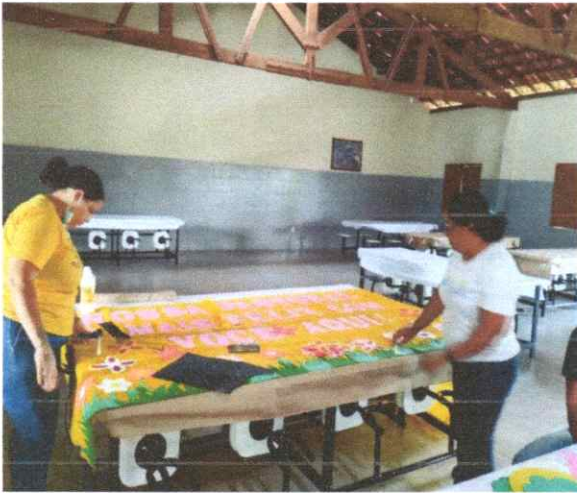
MONTAGEM DO PAINEL