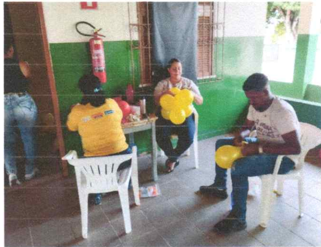
ARRUMAÇÃO DO ESPAÇO P/FORMAÇÃO