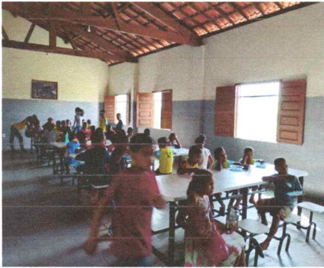
HORA DO LANCHE