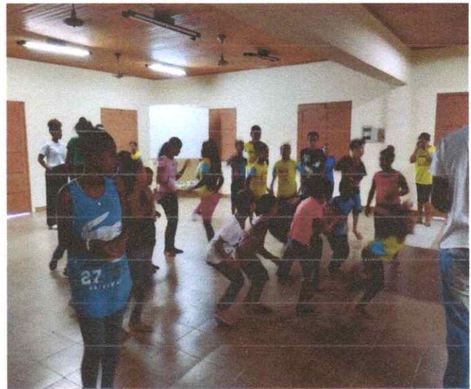
MOMENTO DESCONTRAÇÃO NA FORMAÇÃO