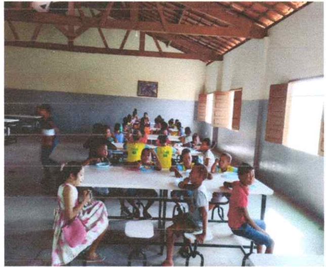
HORA DO LANCHE