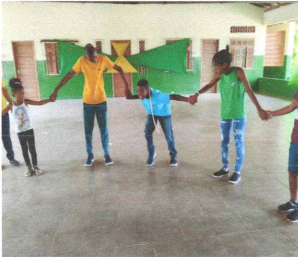
DINÂMICA DO BAMBOLE