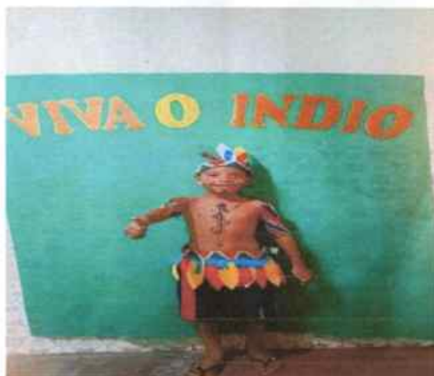
Educando pintado de índio