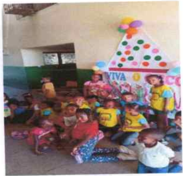
Nossas crianças representando o dia do Circo