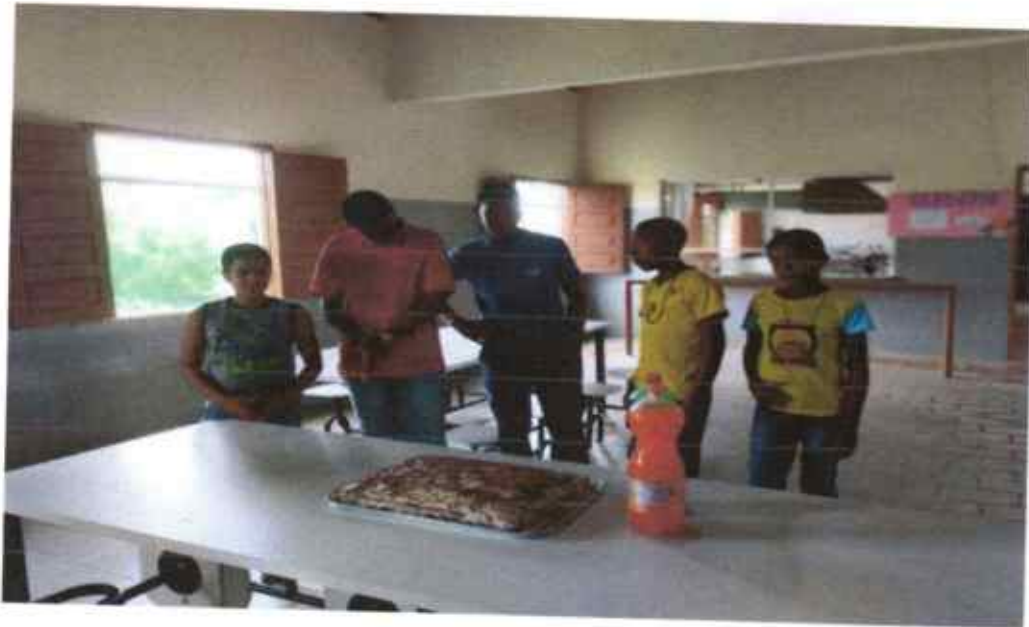
Aniversariante do mês.