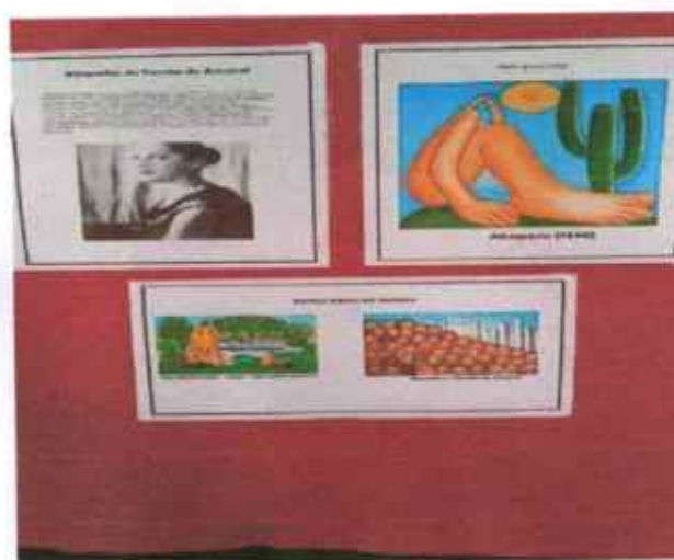
Trabalho com a arte