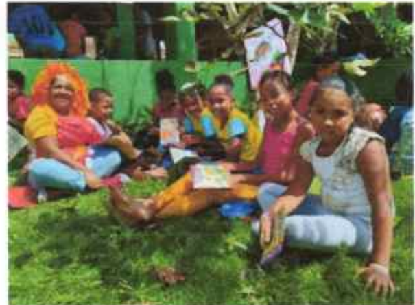
Educandas no piquenique literário