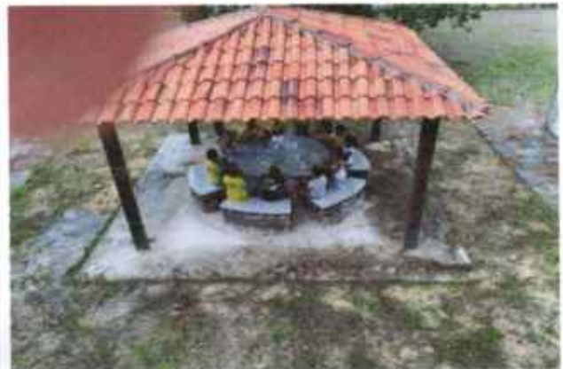
Aulas de flauta ar livre