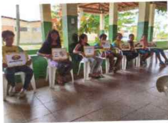
Representação Páscoa nos cartazes