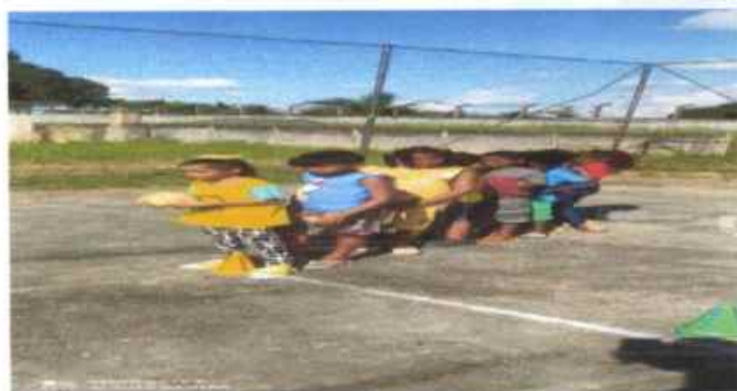
Atividades de Educação Física