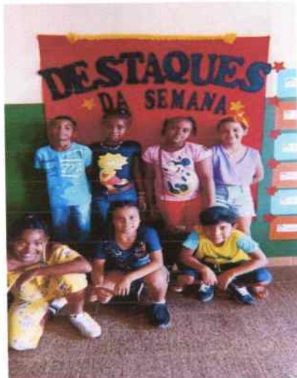
valorizando o desempenho dos educandos