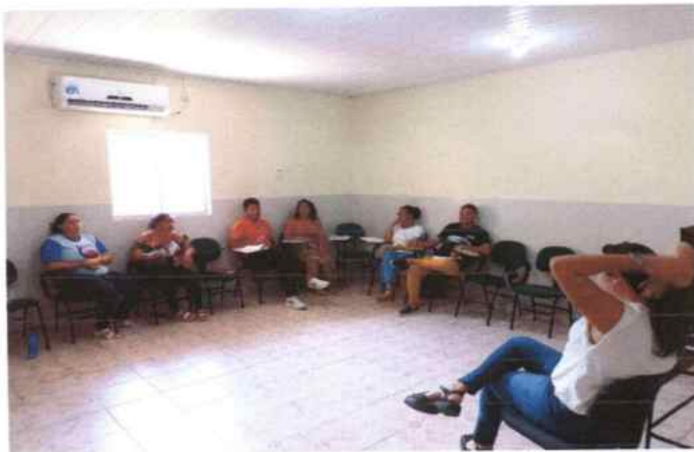
3 Formação sobre Bullying