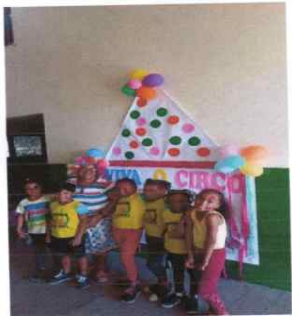
Compartilhando a alegria dos nossos educadores, juntamente com nossos educandos.