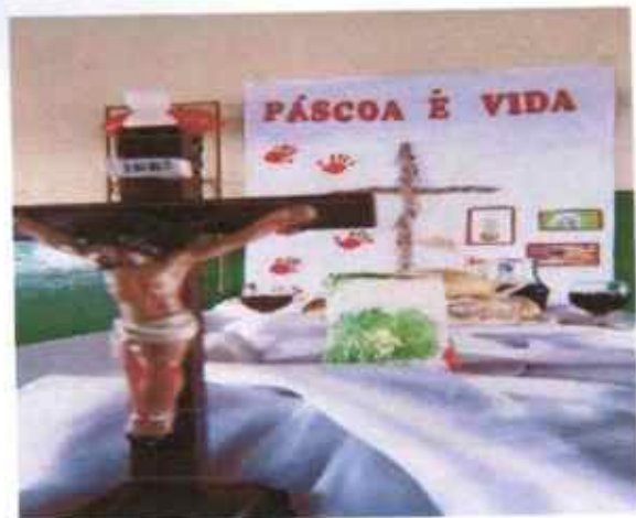
Mesa da Páscoa