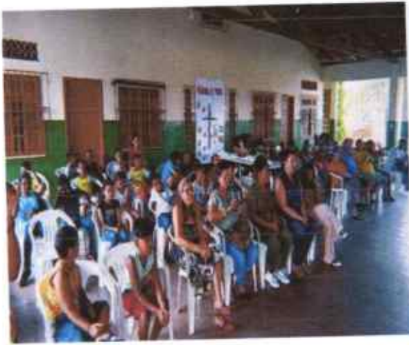
2 Celebração da Páscoa