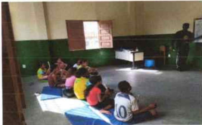
Aulas de flauta pedagógica