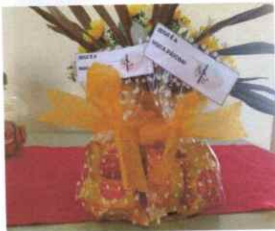
Lembrancinhas da Páscoa