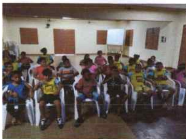
Assistindo o filme Tainá