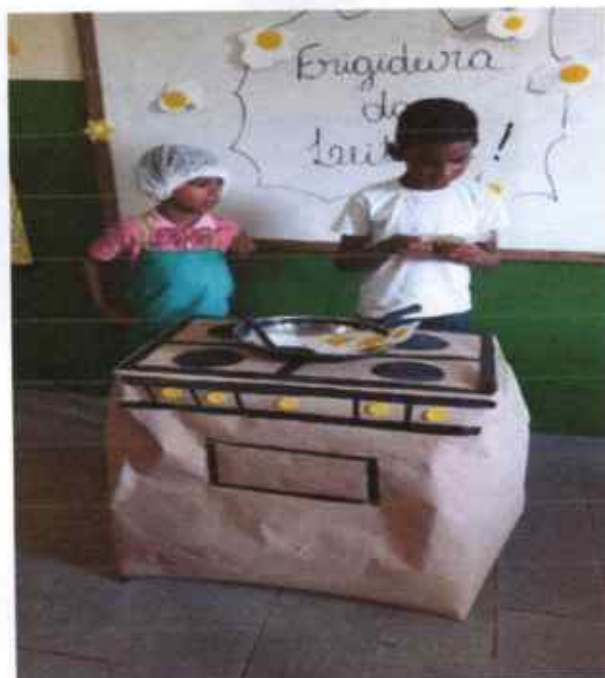
Cozinhando também se aprende a lê!