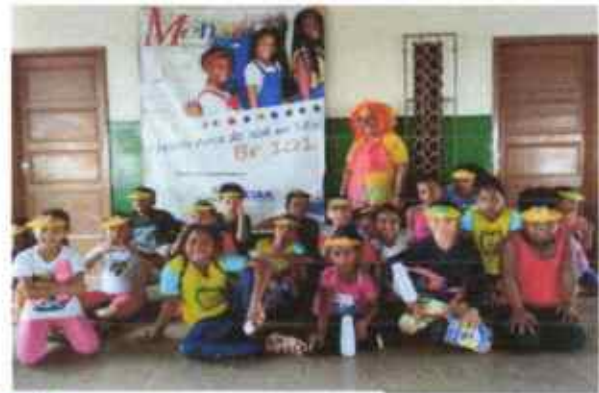
Compartilha dos livros no piquenique literário