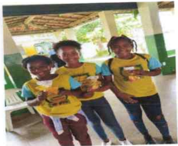
Educandos recebendo a lembrancinhas