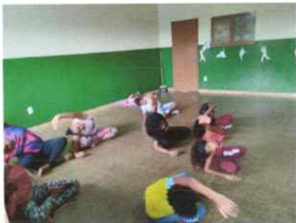
Aula de dança