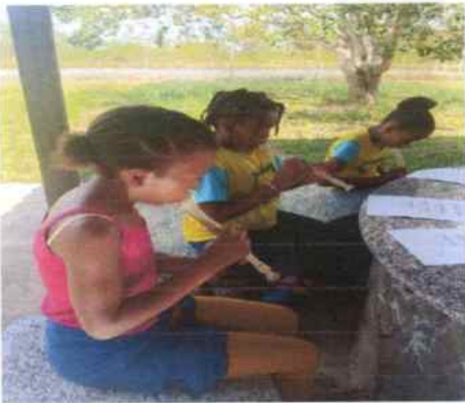
Aulas de flauta