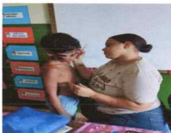
Os educadores pitando os educandos; dia do circo.